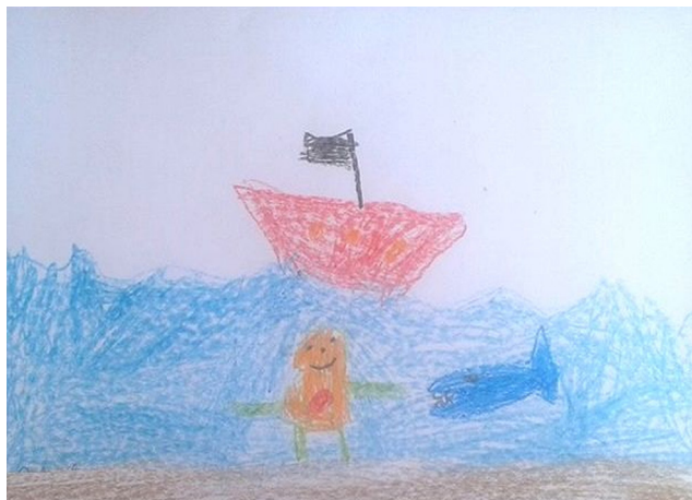
Figura 05: Desenho de Rafael: livro A escolinha do mar .

As crianças escolhem as cores de giz de cera que irão utilizar e começam seus desenhos. (Entrevista 014)