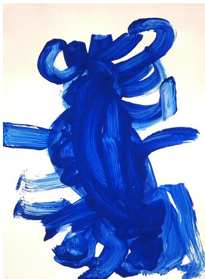
Figura 04: Desenho de Nívia: livro O domador de monstros .

Nívia imita um monstro, alterando sua voz, o que faz as crianças rirem.