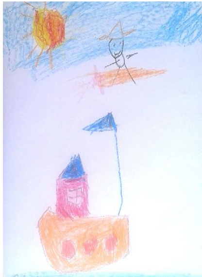
Figura 02: Desenho de Rafael: livro A caixa surpresa.

Rafael: É. É o Sol que eu inventei. Porque é caixa de imaginação. (Entrevista 011)