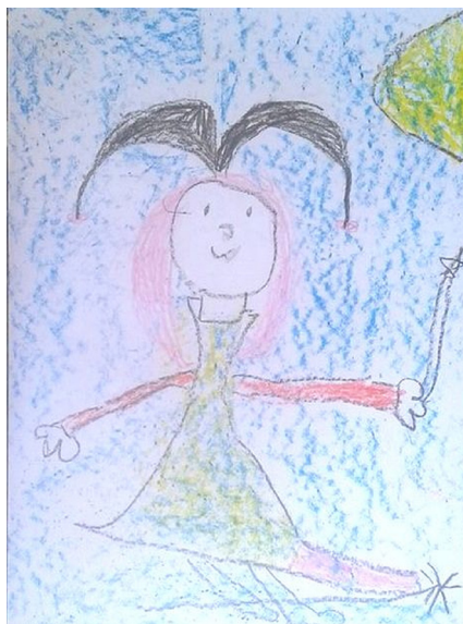
Figura 03: Desenho de Luise: livro A caixa surpresa .

Pesq.: Olha... Então você inventou uma bruxa nova? (Entrevista 011)