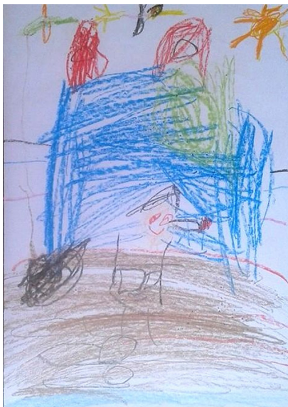
Figura 01: Desenho de Vicenzo: livro A caixa surpresa .